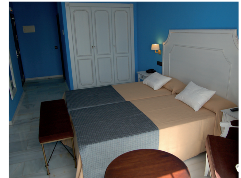
Estas cuatro habitaciones muestran los diferentes y personales diseños, que Intea ha desarrollado para satisfacer las demandas del hotel.

TRATO PERSONALIZADO. La filosofía que se imprime desde la gestión del hotel es la atención personalizada, cercana y familiar del cliente