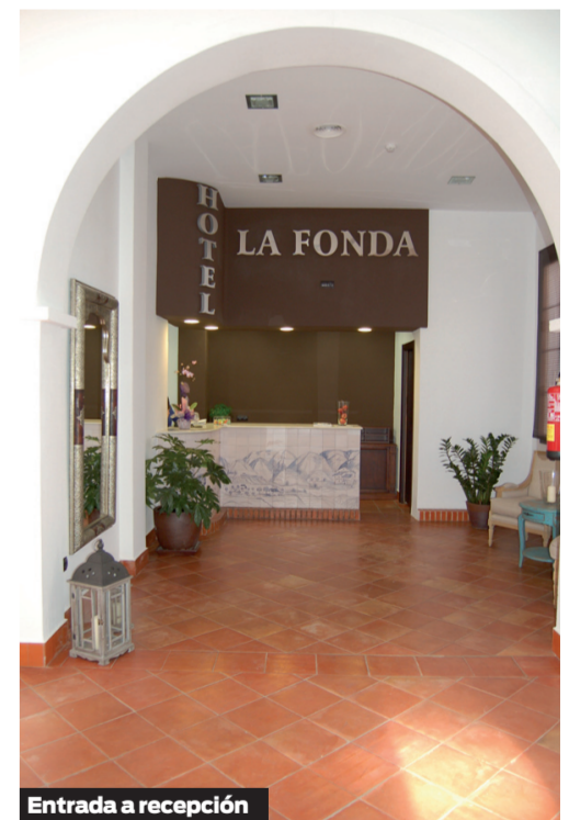
Entrada a recepción

Estos expertos en interiorismo disponen de dos fábricas de muebles, dedicadas única y exclusivamente a la fabricación de mobiliario para habitaciones de hoteles y ebanistería a medida para áreas públicas, empleando siempre maderas nobles de primera calidad con bajos grados de humedad y rematando con terminaciones de alta gama. No alojan ningún modelo estandarizado o definido, ya que los talleres elaboran muebles a medida, sin límites de diseño, en cualquier tipo de madera, chapas, tableros, y, por supuesto, en cualquier clase de acabado.