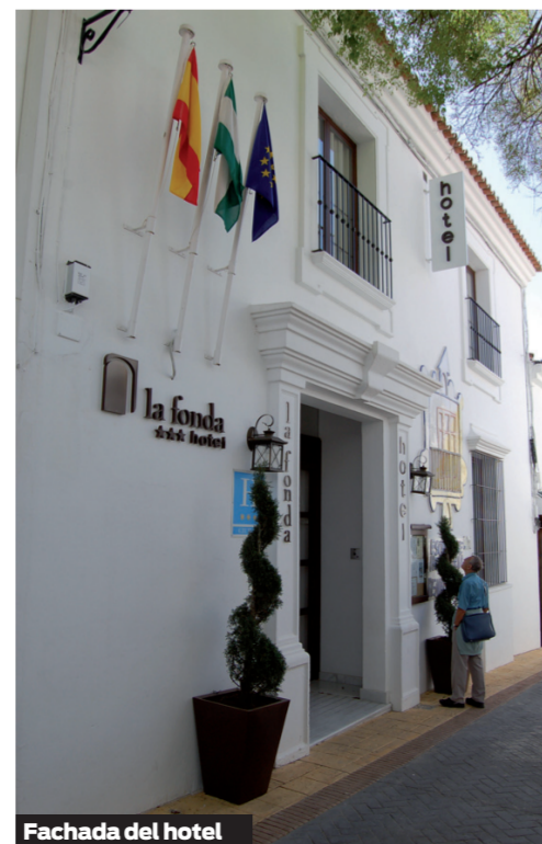
Fachada del hotel