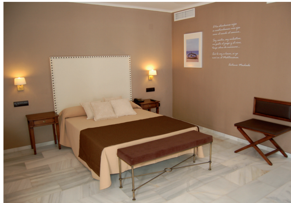
Vistas de dos habitaciones, de distintos ambientes, que los propietarios del hotel junto a Intea han confeccionado para el disfrute de sus clientes.